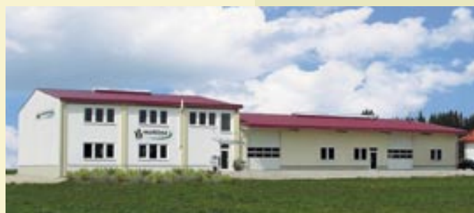
Verwaltungs- und Produktionsstätte

Als 1952, der Firmenname „Mattina“ zum eingetragenen Markenzeichen wurde, war eines schon klar: nur durch die eigene Anforderung an höchste Qualität wird das Unternehmen langfristig seine Daseinsberechtigung bewahren. Diese Philosophie gab allen Beteiligten recht. Heute produzieren wir im eigenen Haus eine nahezu unüberschaubare Anzahl von individuellen Produkten zur Absatzsteigerung und Verkaufsförderung.