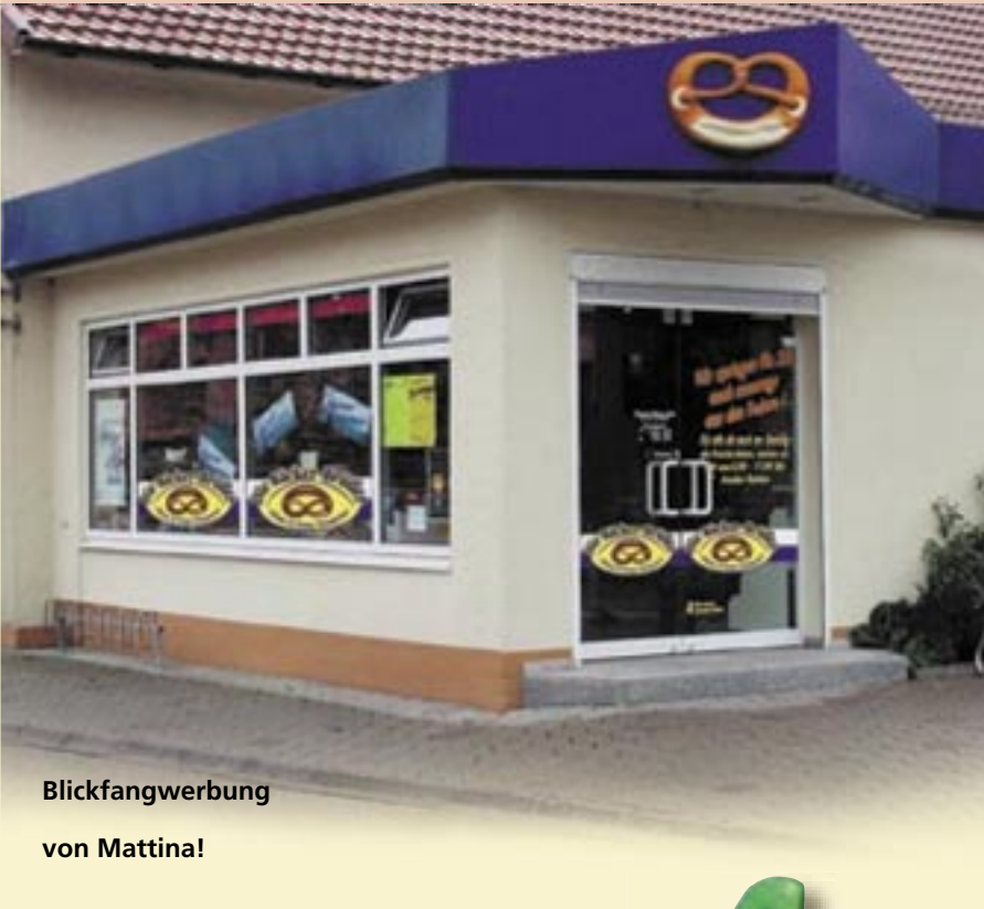
Blickfangwerbung von Mattina!